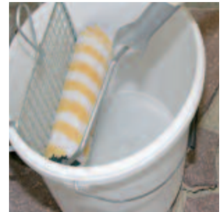
Vor dem Auftrag überschüssiges Material an einem Abstreifgitter entfernen...

Verunreinigungen nach Erhärtung des Fugenmaterials mit einem Hochdruckreiniger entfernen. Bei hartnäckigen Rückständen empfehlen wir den Einsatz eines Dampfstrahlgeräts.