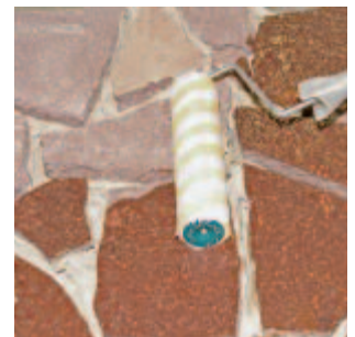
... anschließend PCI Pavifix V deckend auf die Steinoberfläche auftragen.