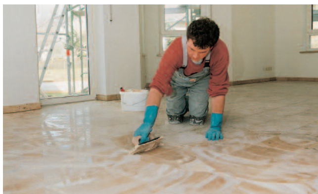
Naturwerksteinplatten mit dem Spezial-Fugenmörtel PCI Carrafug verfugen und Boden- und Wandanschlussfugen im System mit dem Silikon-Dichtstoff PCI Carrafem schließen.