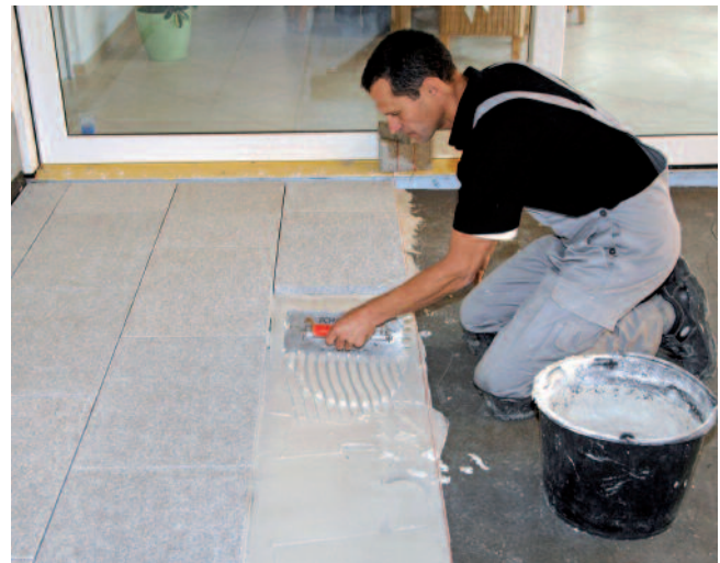
Mit dem weißen Verlegemörtel PCI Carrablott NT können auch kritische Naturwerksteinplatten sicher verlegt werden.

Kunststeinbeläge wie z.B. Padang, Kashmir White, Serpentinite und Agglo-Marmor.